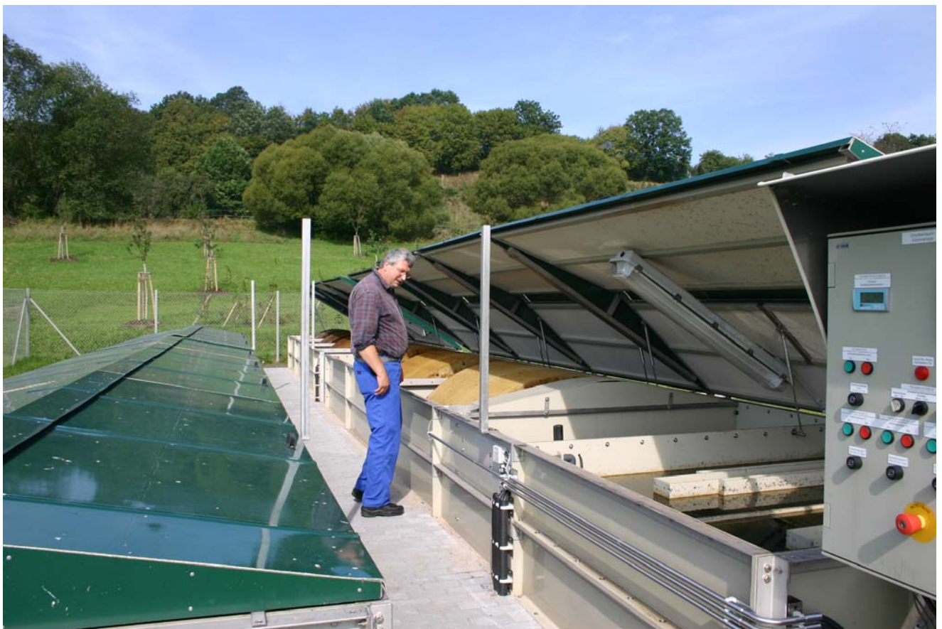
Scheibentauchkörperanlage der Kläranlage Werschweiler

Nach der biologischen Reinigung fließt das Abwasser zur Nachklärung durch einen Lamellenseparator, wo Schlamm und gereinigtes Abwasser getrennt werden. Zur Stabilisierung des