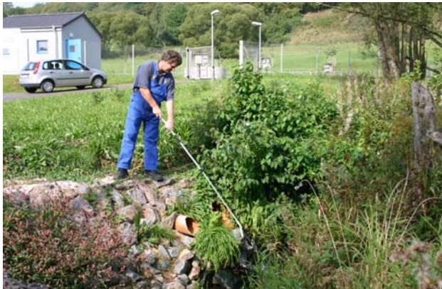
Probenahme am Auslauf der Kläranlage

Das bestens gereinigte Abwasser wird über eine Überlaufrinne in einen Graben abgeleitet, der zur Oster abgeleitet. Auf der Fließstrecke bis zur Einmündung in die Oster finden weitere Abbauprozesse statt.