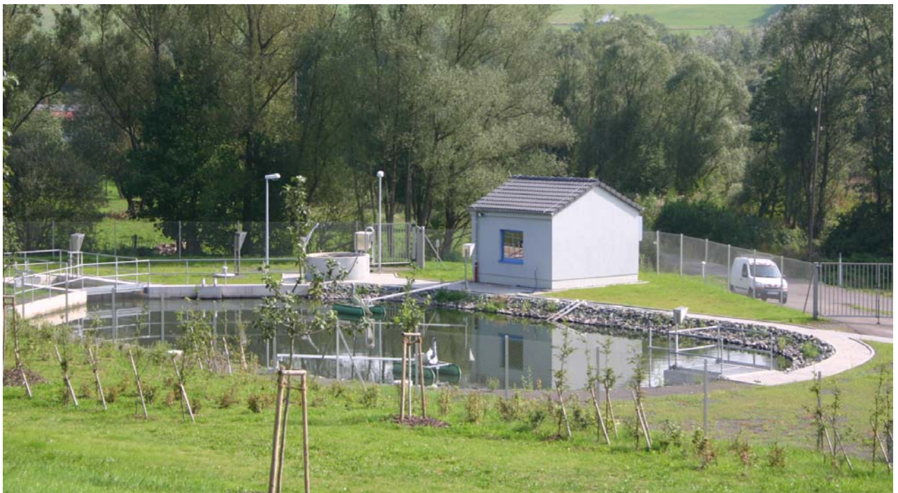
Gesamtansicht der Kläranlage Werschweiler

* Ein Einwohnerwert entspricht der Abwasserbelastung, die ein Einwohner am Tag verursacht.