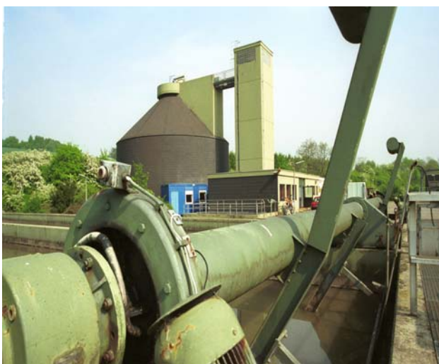
Die Kläranlage Walpershofen mit Faulturm: Hier wird der Klärschlamm mitbehandelt.