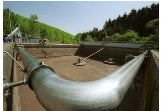
Von der Sieb- und Sandfanganlage fließt das Abwasser im freien Gefälle zur biologischen Reinigung in den SBR-Reaktor.