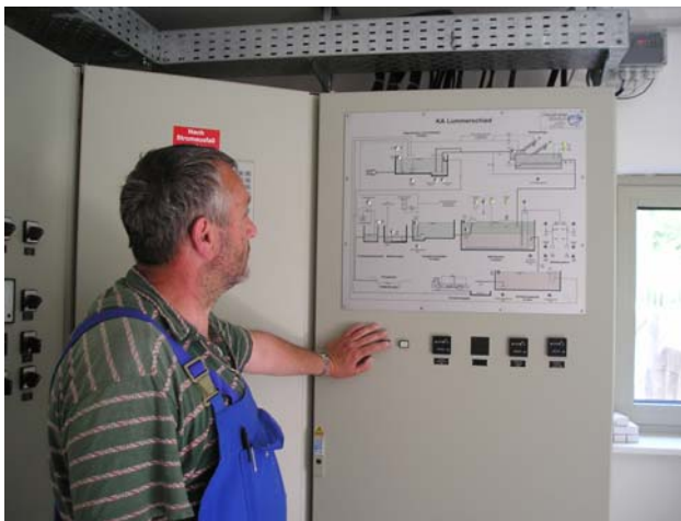
Mitarbeiter der Zentralkläranlage Holz überwachen den Betriebsablauf.

Die Kläranlage Lummerschied hat kein eigenes Betriebspersonal, sondern wird aus Gründen der Effizienz und Kostenersparnis von der Zentralkläranlage Holz mitbetrieben.